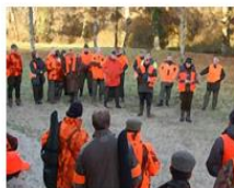
Toujours écouter les consignes du responsable de battue

Privilégier de faire l'appel des chasseurs à haute voix et le responsable de battue renseignera le cahier, pas de signature cette année.